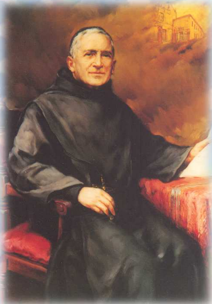
P. Benito Menni

Evangelio: Juan 13, 33-33a.34-35 «Os doy un mandamiento nuevo: que os améis unos a otros»